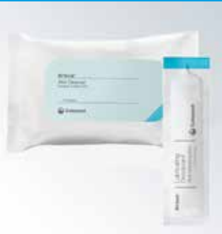
Hautreinigungstücher & geruchsneutralisierendes Gel